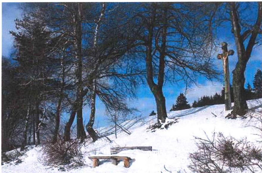
Okolo dávných polních cest často objevíte drobné památky, například tento vysoký, téměř dvousetletý kříž na úbočí vrchu Šibenice.

Kousek za křížovou cestou odbočuje běžkařská spojnice, která jihozápad Novoměstska provázala s jeho severem. Páteřní trasa se ale klikatí dolů do Veselíčka – nejzápadnějšího nástupního místa do zdejších udržovaných stop. Ty začínají bezprostředně vedle kolejí na místním nádraží. Pak pokračují do blízkosti Slavkovic, Jam a Hlinného. Také tady převládá těžký relax – rovinka, občas mírný kopec, poté krátký výstup a lehký