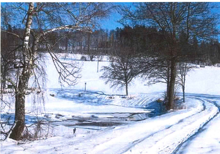
Lesy, vršky, louky, pole, meze i remízky. A opodál rozptýlené vísky i oka zamrzlých rybníků. Žďárské vrchy jsou mozaikou, která se neokouká.