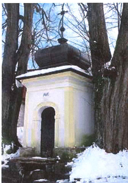
Ačkoli kapličku na Zásranci zdobí letopočet 1810, tato svatyně zde stála již dříve.